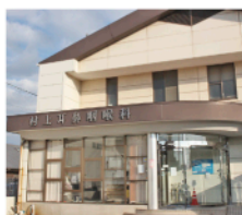
▲開業37年で地域に愛される耳鼻科

ギー性鼻炎の患者さんには、症状が現れる前や軽いうちに抗アレルギー薬（第二世代抗ヒスタミン薬）の服用を開始する初期治療法を推奨し、症状の抑制や軽減に努めています。院内には、一般聴力検査、耳鳴検査、チンパノメトリーなどの聴力検査設備や、喉頭ファイバーなどの内視鏡検査設備なども充実。待合室は明るく清潔な空間を提供し、リラックサして過ごせる環境を整備しています。