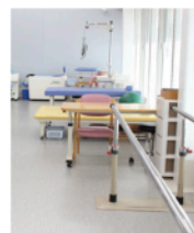
▲広々としたリハビリ室