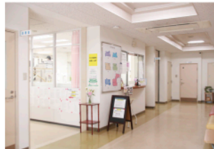
▲さくら苑の施設内

がけて日々診療を行っています。 月曜日9時から12時は脳神経外科、火曜日の9時から12時は整形外科に愛大医師が来て診察をしてくれます。 高齢化社会の需要にも