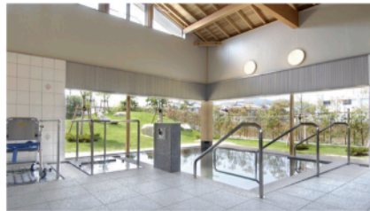
▲リフト浴もできる広々としたお風呂窓から眺められる庭園にも癒されます