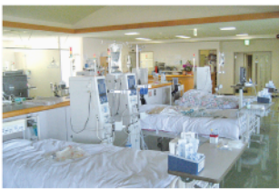
▲明るく衛生的な人工透析室

昭和56年12月に開院し、44周年を迎えた今治南病院は、清水・朝倉地区を始め、近隣地域の住民の皆さんのかかりつけ医として、地域の医療に貢献してきました。内科・外科・泌尿器科（人工透析）を中心に病棟55床・介護医療院8床の合わせて、63床の入院ベッドを備えています。