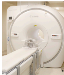
▲超電導磁石式全身用MR装置 (MRI)