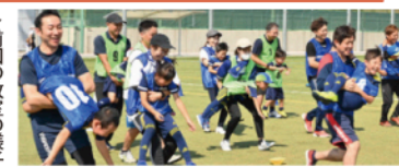
▶前回の教室の様子

象は年中児、年長児小学1年生。1人につき保護者1人の同伴が必要で、親子での教室参加となります。参加費3000円(当日現金にてお支払い)。特典は当日14時キックオフのFC今治vs藤枝MYFCの試合観戦チケット(保護者1枚、お子さま1枚)参加賞(タオルマフラ)1組1枚です。☎090-2789-2119 (FC今治事務局ホームグロウングループ)