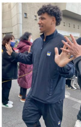
▲昨年 MVP に選ばれたヴァニシウス選手

象は年中児、年長児小学1年生。1人につき保護者1人の同伴が必要で、親子での教室参加となります。参加費3000円(当日現金にてお支払い)。特典は当日14時キックオフのFC今治vs藤枝MYFCの試合観戦チケット(保護者1枚、お子さま1枚)参加賞(タオルマフラ)1組1枚です。☎090-2789-2119 (FC今治事務局ホームグロウングループ)