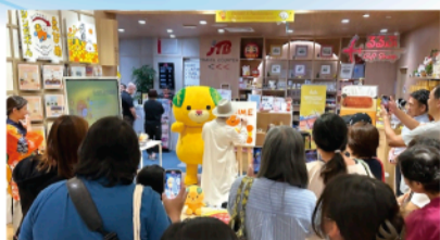
▲シンガポールで開催したライブイベントのイベント

1987年2月13日生まれ。松山市出身。関西学院大学社会学部卒。2017年、愛媛県庁入庁。趣味はラグビー観戦。