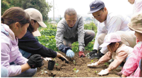
▲2月には収穫体験や料理教室を実施

新都市(2階イオンホール)など市内13ヶ所に設置します。今回の選挙から今治市議会議員の定数は30人から28人になり、現職21人、新人14人が立候補を予定しています。詳しくは今治市選挙管理委員会事務局ホームページをご覧ください。