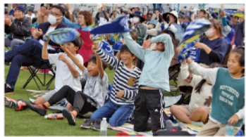
▲今治でも約600人が集い大声援