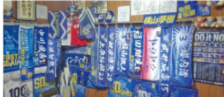
▲自宅の一室はFC今治一色