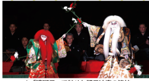
▲「連獅子」で魅せた親子迫真の演技