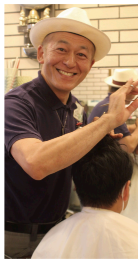
「目の前の人を勇気づけたい」

大阪で磨いた得意のシャンプー、カットが、海外留学で評価され、ポケットに沢山のチップが。平成元年に今治に戻り、1962年創業美容室の二代目に、「目の前の人を勇気づけたい」と笑顔です。 今治市基栄町2丁目3の7 ☎326063