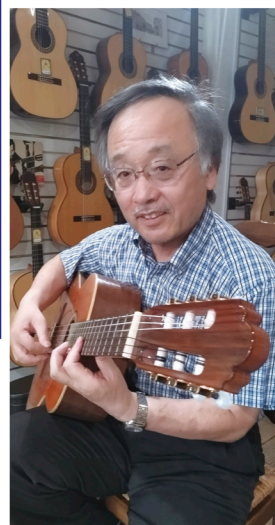
芸術にマニュアルはいらない