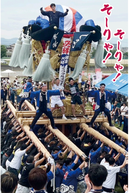
▲ミラクルスマイル新居浜の必勝を祝い、東雲太鼓台を応援かきあげ