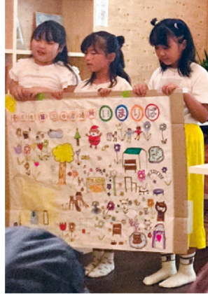
▲当日は4組のプレゼンターと投票者が参加

自分の夢や、まちを盛り上げるためのアイデアを発表する「いまばりスープ」が先週、子ども第三の居場所「いまばり(蒼社町)」で初開催されました。 同イベントは、いまばりスーパ実行委員会が主催。昨市が開いた「いまばり地域共創塾」で出合った有志が、