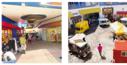
▲同時開催したキッチンカーとフリーマーケット

マイタウン今治新聞社主催の東予地区最大級の住宅イベント「住まいマルシェ」が5月18日、19日にワールドプラザ(東村1)で行われました。両日合わせて約150組、450人が集まり大盛況となりました。 同イベントには、住宅メーカーや工務店、ガス会社など8社が出展。住宅に関する話を聞こうと多くの来場者が訪れました。また、18日にはフリーマーケット、19日にはレクリエーション大会、さらに両日キッチンカーも出店し、家族連れでにぎわいを見せました。 次回は、年内開催予定です。たくさんのご来場をお待ちしております!