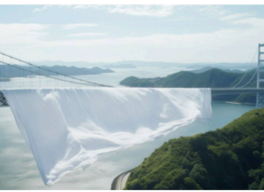
▲来島海峡大橋に覆い被さる今治タオル