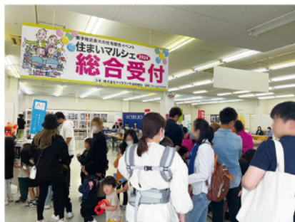
▲多くの人で賑わう会場