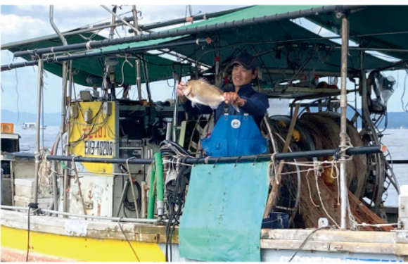
▲「10ノット真鯛」の魅力語る地元漁師

産産ブランド真鯛「10ノット真鯛」(てんのつとま)は、その味とキャッチーなネーミングを評価され、4月から愛媛・広島・岡山地区から寿司各店にて、期間・数量限定で販売が決定。 今回のつながりを